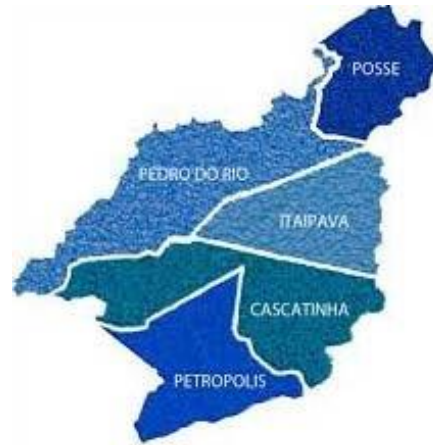
Figura 1 - Representação de Petrópolis com seus respectivos distritos (Plano Diretor de Petrópolis, 2014).

Petrópolis apresenta um clima quente e temperado. Existe uma pluviosidade significativa ao longo do ano. A temperatura média é de 18.4°C. No mês de fevereiro, o mês mais quente do ano, a temperatura média é de 21.7°C. A temperatura média em julho, é de 15.2°C. A pluviosidade média anual é de 1929mm. O mês mais seco é julho e tem 56 mm de precipitação. O mês de maior precipitação é dezembro, com uma média de 307 mm.