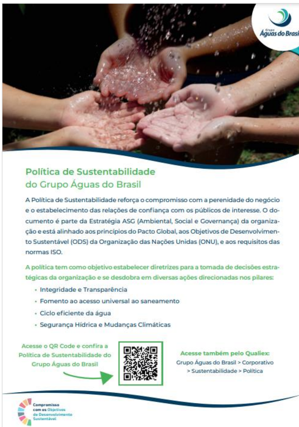
Figura 1: Política da Sustentabilidade

A Águas do Imperador é atendida pela Política de Sustentabilidade do Grupo Águas do Brasil, holding que possui os direitos sobre a empresa auditada. A política aborda os aspectos pertinentes as operações com o objetivo de gerar valor compartilhado para o negócio, meio ambiente e parte interessadas e é extensiva para todas as unidades do grupo. A imagem apresentada a seguir ilustra a Política de Sustentabilidade na íntegra: