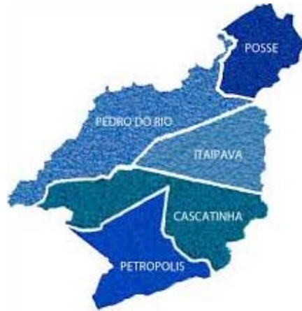
Figura 1 - Representação de Petrópolis com seus respectivos distritos (Plano Diretor de Petrópolis, 2014).

Petrópolis apresenta um clima quente e temperado. Existe uma pluviosidade significativa ao longo do ano. A temperatura média é de 18.4°C. No mês de fevereiro, o mês mais quente do ano, a temperatura média é de 21.7°C. A temperatura média em julho, é de 15.2°C. A pluviosidade média anual é de 1929mm. O mês mais seco é julho e tem 56 mm de precipitação. O mês de maior precipitação é dezembro, com uma média de 307 mm.